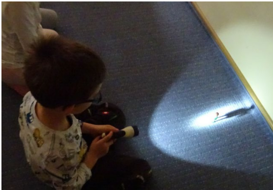
Kindergartenprojekt: Licht und Schatten

„Lernen ist Erfahrung. Alles andere ist einfach nur Information.“ Albert Einstein