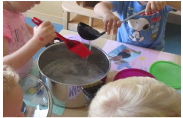
Krippenprojekt: In der Küche