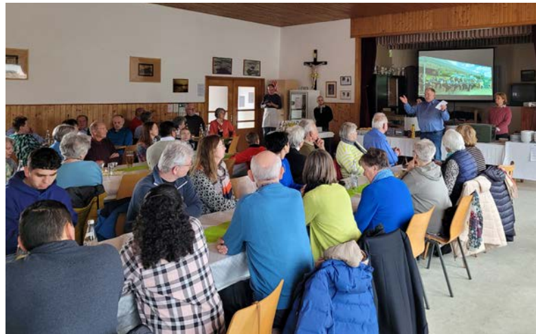
Gut gefüllt war das Pfarrheim zum diesjährigen Fastenessen.