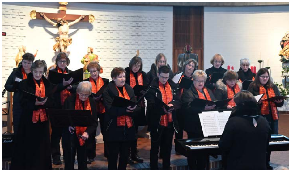
Der Liederkreis gab beim Adventssingen auch selbst besinnliche Klänge zum Besten.