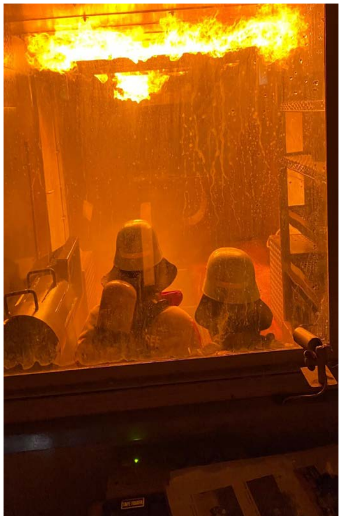
Ein Blick in den Brandcontainer: Durch die Brandsimulation werden im Raum Temperaturen von mehreren hundert Grad Celsius erreicht..