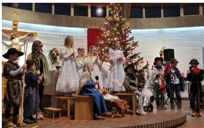
Das Krippenspiel war erwartungsgemäß ein Highlight bei der letzten Christmette.