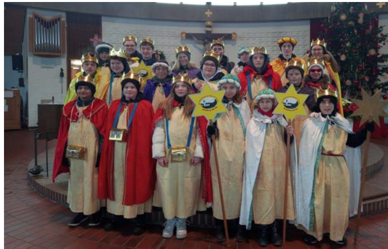
3.000 Euro konnten die Steinberger Sternsinger in diesem Jahr für Bedürftige sammeln.

Pfarreiengemeinschaft Wackersdorf-Steinberg am See William Funke