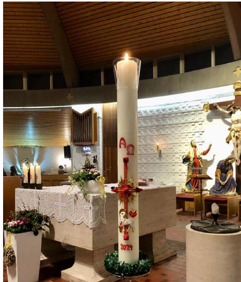
Festlich geschmückt präsentierte sich die Pfarrkirche zum Osterfest.

Dank der großartigen Leistung des Seelsorgeteams konnten auch in diesem Jahr wieder zahlreiche Gottesdienste und Wortgottesfeiern stattfinden. Die Steinberger fanden sich am 31. März zahlreich in ihrer Pfarrkirche St. Martin ein, brachten Osterkörbchen und Osterkerzen zur Segnung und feierten freudig gemeinsam die Heilige Messe. Gestaltet wurde der Gottesdienst durch Pater Joseph, der der Messe vorstand, und der Bläsergruppe Steinberg am See, die die Messe musikalisch begleitete. Pater Joseph, der im Vorfeld bei allen Proben der Ministranten fleißig mithalf, betonte in seiner Predigt das Prinzip der Hoffnung, dass uns die Auferstehung Jesu Christi so deutlich vor Augen führe. Zum Abschluss der Messe verteilte der Pfarrgemeinderat aus Steinberg am See noch ein Osterei an jeden Gläubigen. Ein Dank geht an alle, die in dieser Osterzeit wieder tatkräftig mitgeholfen haben.