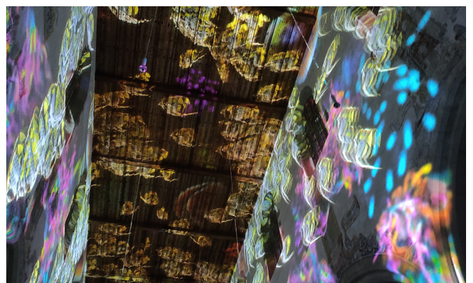
Die Show hüllte die Regensburger Minoritenkirche in fantastische Lichtwelten und sorgte für bleibende Eindrücke.

Genesis II, eine Lichtershow zur Schöpfungserzählung der Bibel, war das Ziel der Fahrt des Katholischen Frauenbundes im Januar. Schon vor einem Jahr hatten viele Frauen den ersten Teil der Schöpfungsgeschichte in Regensburg gesehen und waren nun auf die Fortsetzung gespannt. Auch einige Männer und Frauen aus Wackersdorf waren dabei, um die Lichter-Illumination in der Minoritenkirche zu sehen. Nach der Begrüßung im Bus gab es eine kurze Einführung zur literarischen Gestaltung und zum Inhalt der biblischen Schöpfungserzählung. Es folgte die Lichtshow: Farbenfrohe Bilder zur Erschaffung der Pflanzen, Tiere und des Menschen bewegten sich über die alten Mauern der Kirche und hinterließen einen tiefen Eindruck. Danach folgte ein kurzer Spaziergang durch die Altstadt mit einem Stopp in der Maria Lang Kapelle, die sehr verborgen liegt und nur wenigen bekannt ist. Bei einem guten Essen im schönen Gasthof Bischofshof klang der Abend gemütlich aus.