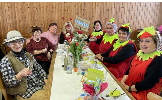
Standesgemäß ging's auch bei den Kostümen kreativ zu.