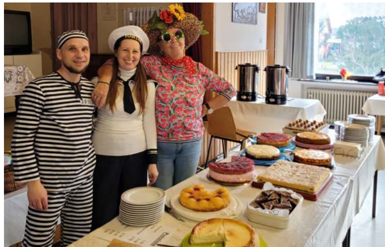
Die Faschingsgäste im Pfarrheim wurden durch den Pfarrgemeinderat bestens versorgt.

Der Faschingszug durch Steinberg am See stellt immer den Auftakt der Feierlichkeiten dar. Im Anschluss laden diverse Vereine zum Weiterfeiern ein. So auch der Pfarrgemeinderat aus Steinberg am See, der zu Kaffee, Kuchen und dem ein oder anderen Kaltgetränk in das Pfarrheim einlud. Dieser Einladung kamen auch dieses Jahr wieder zahlreiche Gäste nach, die das Pfarrheim bis beinahe auf den letzten Platz füllten und für eine großartige und ausgelassene Stimmung sorgten. Die Faschingsfeier im Pfarrheim erfreut sich gerade bei jungen Familien und Senioren großer Beliebtheit. Es geht ein herzlicher Dank an alle Helfer und Helferinnen, die diese Veranstaltung wieder möglich gemacht haben, ganz besonders an Hildegard Ernst, die mit ihrem Engagement stets vorausgeht.