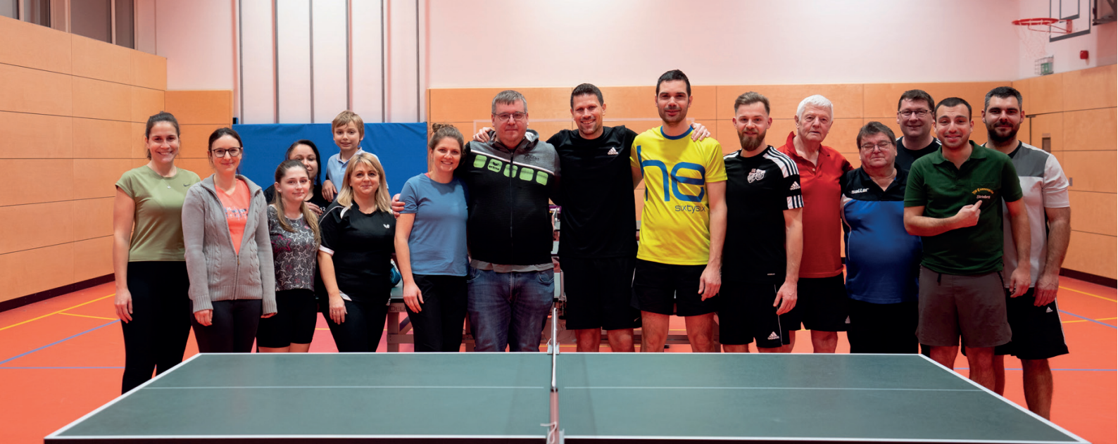
An der Dorfmeisterschaft durften abermals alle Steinbergerinnen und Steinberger teilnehmen, die nicht aktiv im Verein spielen.