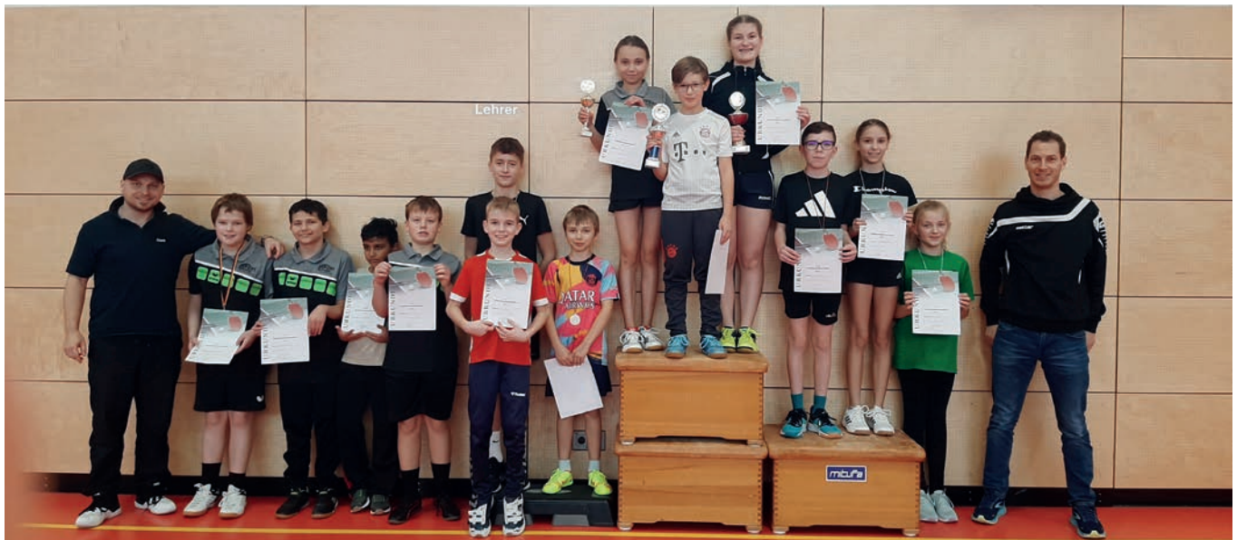
Einen 0:10-Satzrückstand gedreht: Bei den Vereinsmeisterschaften der DJK Tischtennis ging es teils unglaublich spannend zu.