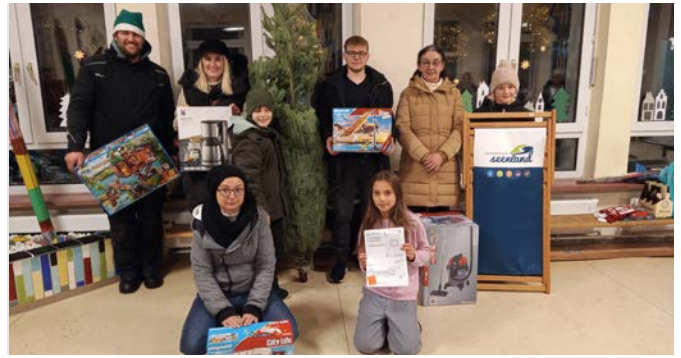
Eine Auswahl der Hauptpreise mit ihren glücklichen Gewinnern: Die Weihnachtsmarkt-Tombola ist mittlerweile Kult.

Am ersten Dezembersamstag fand der traditionelle Weihnachtsmarkt an der Grundschule Steinberg am See statt. Die große Herausforderung meisterte das Team mit Bravour – womit sie einmal mehr die Dorfgemeinschaft stärkten. Die Gäste durften sich über musikalische Einlagen von Kita und Grundschule, vorgetragene Weihnachtsgedichte, einen Lichtertanz und natürlich über klassische Marktangebote wie Glühwein, Gegrilltes, Kartoffelsuppe, Waffeln, kalte Getränke sowie allerlei Gebasteltes und Handwerkskunst freuen. Für Kinderpunsch und Glühwein gab es in diesem Jahr eine eigens für den Weihnachtsmarkt kreierte Tasse, die man käuflich erwerben konnte. Für die kleinen Besucher betreute das Kitapersonal in der Aula eine Bastelecke, wo eifrig gemalt, geschnitten und geklebt wurde. Ein besonderes Highlight war abermals die Tombola des Elternbeirats mit Preisen im Gesamtwert von über 4.000,- Euro. An dieser Stelle nochmals ein großes Dankeschön an alle Sponsoren! Als Hauptpreise durften Tickets für den FC Bayern, ein Baumhaus von Playmobil, ein Tannenbaum sowie eine Kaffeemaschine an die glücklichen Gewinner überreicht werden.