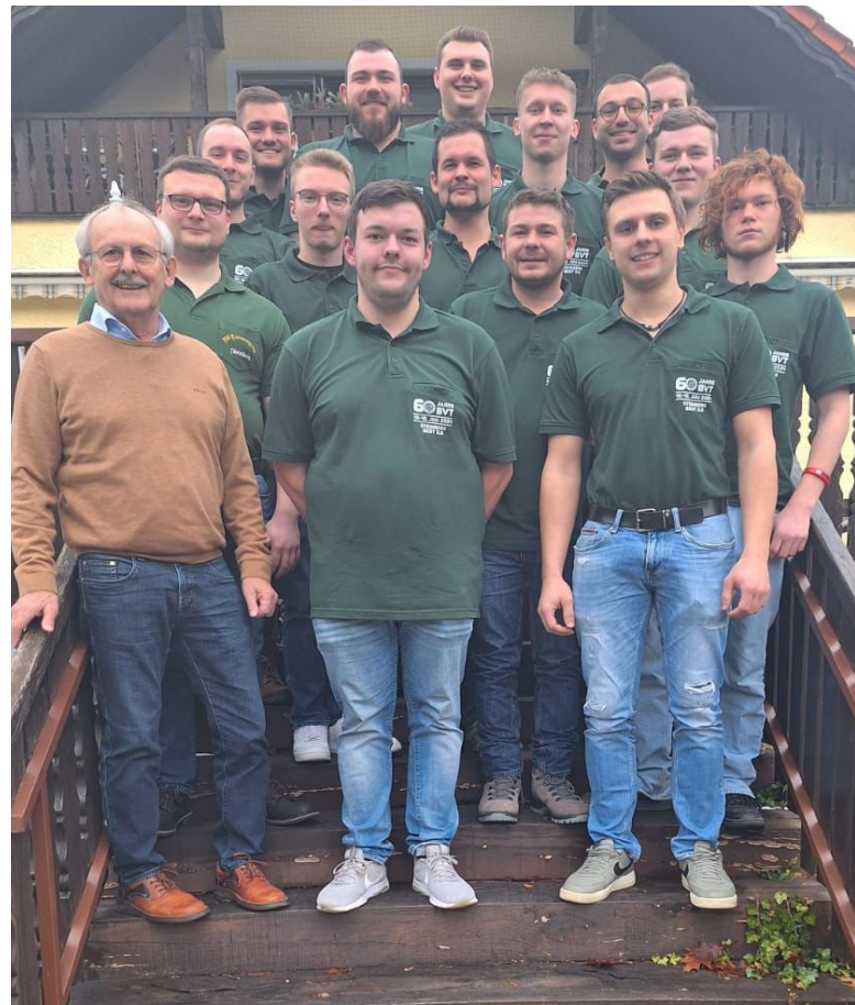
Die Steinberger Burschen mit ihrem Festausschuss fiebern ihrer diesjährigen Kirwa und dem großen Jubiläumsfest entgegen.

Der Burschenverein Tannengrün Steinberg hofft auf eine erfolgreiche Kirwa und ein gut abzuhaltendes Fest ohne größere Zwischenfälle und lädt die Bevölkerung hierzu recht herzlich ein. Auch würde sich der Verein über rege Teilnahme der dorfansässigen Organisationen am Festzug freuen. Außerdem bietet er allen interessierten Burschen ab dem 16. Lebensjahr an, sich dem Verein anzuschließen. Monatssitzungen sind jeden ersten Mittwoch im Monat um 20 Uhr im Vereinslokal „Café Hauser“.