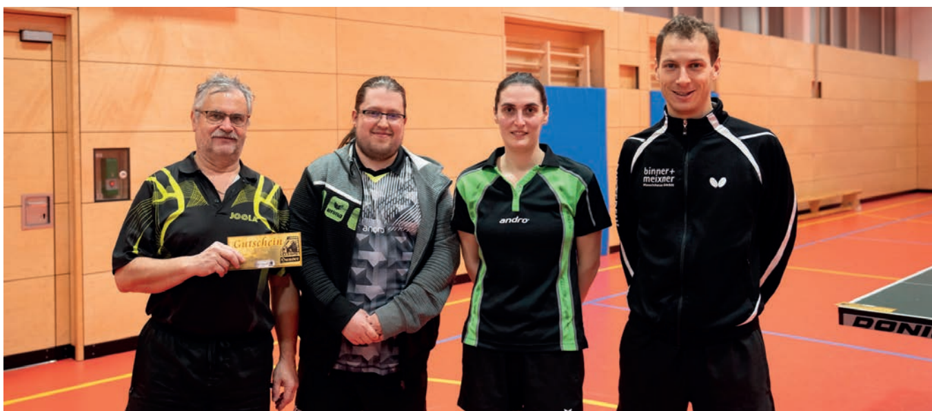
Als kleine Anerkennung für die sportlichen Erfolge gab es einen Gutschein für das Café Hauser.