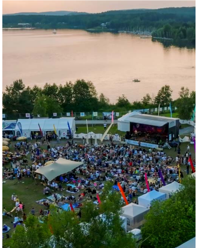
Alle Fotos vom diesjährigen Festival: Yoga Sound & Sea