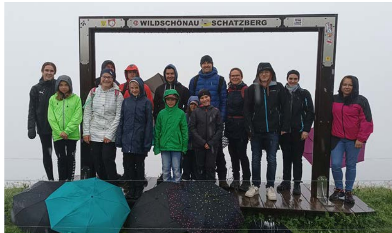
Beim 4-tägigen Familienausflug trotzten einige DJK'ler dem Wetter und bestiegen auch bei Schnee und Regen den Schatzberg.