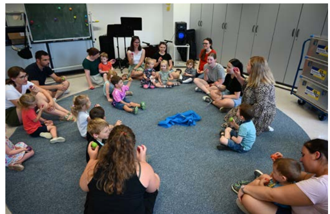
Hör mal, wer da rasselt! Schon Kinder ab zwei Jahren können spielerisch an das Thema Musik herangeführt werden.