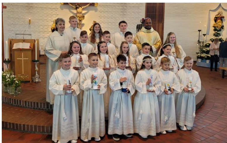
Im besonders festlichen Rahmen empfangen 13 Kinder die heilige Erstkommunion.

Im Anschluss fanden sich die Gläubigen zahlreich zum Birkerfest im Feuerwehrhaus ein. Der Pfarrgemeinderat versorgte die Besucher mit Bratwürsten, während die Feuerwehr Getränke ausschenkte. Der Frauenbund Steinberg am See bot zudem Kaffee und Kuchen an. Auch hier sorgte die Musikkapelle Schwarzenfeld wieder für beste Stimmung. Nachdem dann auch noch das Wetter ein Einsehen hatte, stand einem gelungenen Tag nichts mehr im Wege. Der Erlös des Birkerfests kommt wie im letzten Jahr wieder der Jugendfeuerwehr und den Ministranten zugute. Ein herzliches Vergelt's