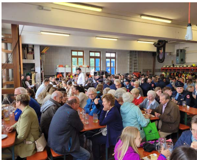
Dicht an dicht reiheten sich die Gäste beim Birkerfest am Feuerwehrhaus – bzw. wetterbedingt zeitweise im Feuerwehrhaus.

Gott geht an die Familien, die sich wieder bereiterklärt hatten, die Altäre herzurichten, und an alle Helfer, die zu dieser gelungenen Feier beigetragen haben.