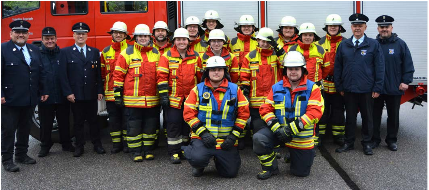
Prüflinge, Ausbilder und Schiedsrichter nach der erfolgreichen Abnahme.