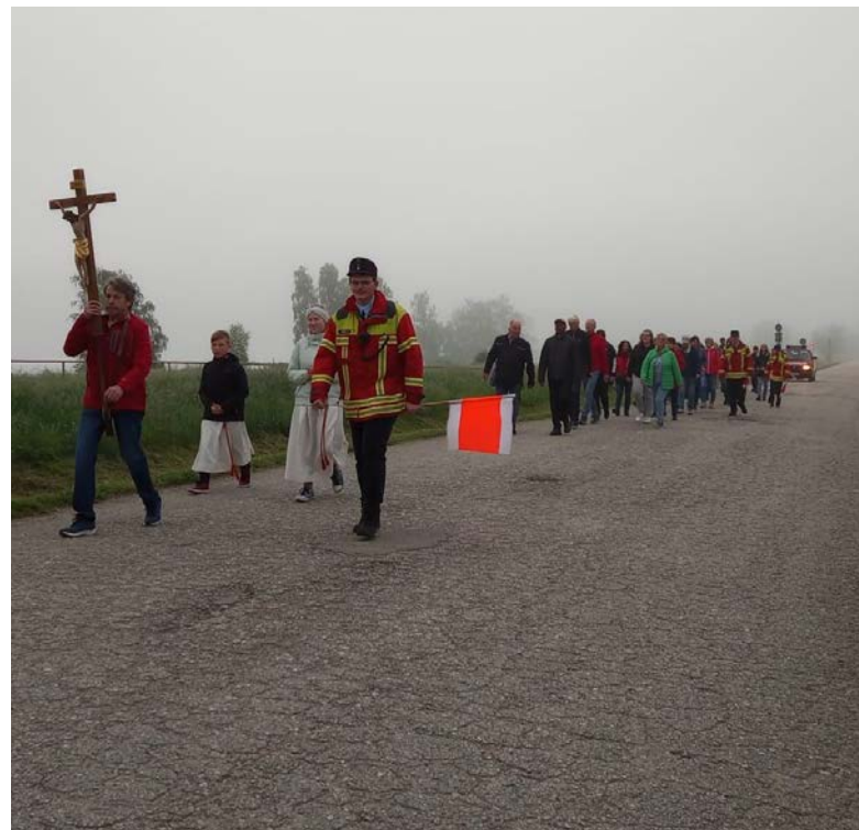
Abgesichert durch die Feuerwehr führte der Bittgang die Gläubigen auf den Schwandorfer Kreuzberg.