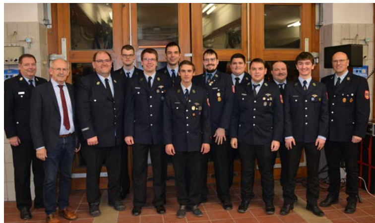
Die geehrten und beförderten aktiven Einsatzkräfte der Wehr.