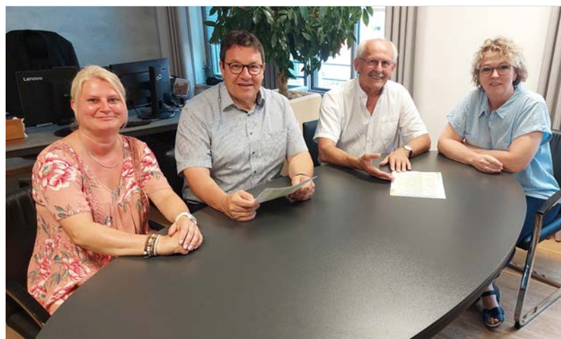
Das Programm wurde wieder gemeinsam mit dem Wackersdorfer Ferienprogramm vorgestellt.