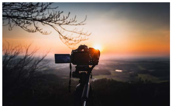
Das Seenland ist wieder auf der Suche nach den schönsten Momenten und Impressionen aus unserer Region!

Weitere Informationen zu den Teilnahmebedingungen und dem Ablauf des Wettbewerbs finden Sie auf www.oberpfaelzer-seenland.de/de/fotowettbewerb .