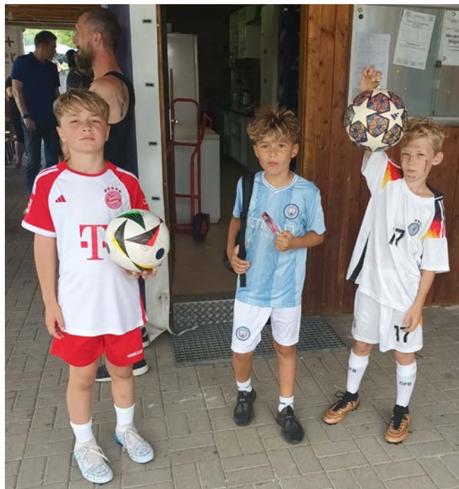
FC Bayern München, Manchester City und die deutsche Nationalmannschaft zu Gast beim Seecup in Steinberg? Nein... drei unserer F-Junioren, die in der neuen Saison in der E spielen.

Turniertag gewann bei den E-Junioren der SC Sinzing vor dem TSV Neutraubling, der DJK Steinberg und dem TSV Kareth-Lappersdorf. Bei den B-Junioren war der Bezirksoberligist SV Schwandorf-Ettmannsdorf nicht in Verlegenheit zu bringen und gewann souverän vor der JFG Oberpfälzer Seenland und dem FC OVI Teunz. Die Konkurrenz der D 1-Junioren entschied der SV Schwandorf-Ettmannsdorf vor dem FC Weiden Ost und der JFG Oberpfälzer Seenland für sich. Beendet wurde das Turnier mit insgesamt 69 Mannschaften aus 34 verschiedenen Vereinen mit den F II-Junioren, bei denen 14 Mannschaften am Start waren. Hier siegte in einem spannenden Finale die SG Vorwald gegen den TSV Kareth-Lappersdorf. Platz 3 sicherte sich der SV Burgweinting mit 1:0 gegen den ASV Fürth. Das große Lob der Gastmannschaften am Turnierende für die mustergültige Organisation ermunterte die Veranstalter, auch im nächsten Jahr diese traditionelle Veranstaltung, die zu den ältesten in der Oberpfalz zählt, durchzuführen – eventuell wieder mit internationaler Besetzung.