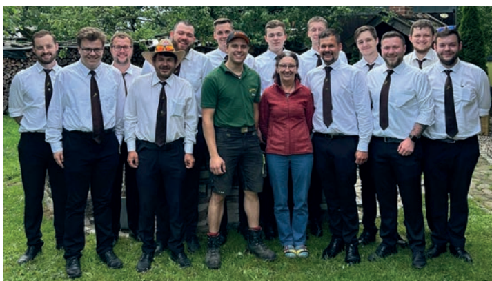
Die Festmutter wurde persönlich zur Kirwa eingeladen.