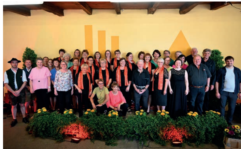
Das Musik-Café des Steinberger Liederkreises ist ein beliebtes Erfolgskonzept.

schen Volkslied „Vem kan segla förutan vind“ und dem Beatles-Klassiker „Let it be“. Der anschließende, anhaltende Applaus war wohlverdienter Lohn für die gesanglichen Leistungen aller Beteiligten.