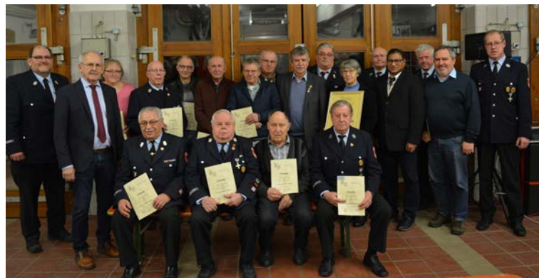
Und die Geehrten des Feuerwehrvereins.