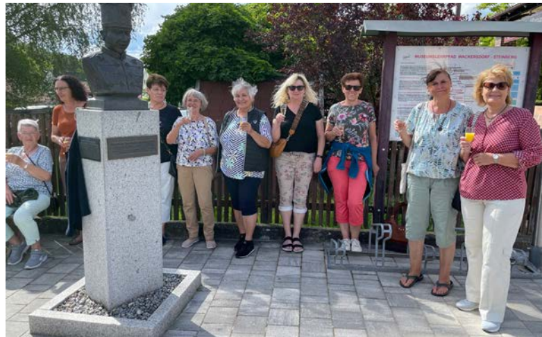
Einen Stopp für Geschichten und Verse legten die Spaziergängerinnen beim Museum ein.

Mit freudiger Erwartung folgten mehr als 20 Frauen der Einladung des Katholischen Frauenbundes zum Muttertagsspaziergang am 15. Mai. Um 16:00 Uhr versammelten sie sich am Brunnen vor der Kirche und machten sich auf den Weg in Richtung Steinberger See. Gleich beim Ponyhof wurden die Wiese und der schattige Platz unter den Bäumen für die erste Station genutzt: Eine Geschichte von den blühenden Blumen, die den Muttertag fürchten, weil die Kinder sie pflücken, brachte alle zum Schmunzeln. Weiter ging es zum Museum, wo die Verse zu den Sorgen und Freuden der Mütter viel Zustimmung fanden und schließlich mit Sekt auf die Verdienste aller Mütter angestoßen wurde. Anschließend gab es ein kleines Geschenk – Magnete mit vielfältigen Sprüchen und Bildern, die stets an diesen Tag erinnern sollen. Auf dem Weg zum Radcafé trug Erika Oberndorfer eine Geschichte vor, die nachdenklich stimmte: Eine Mutter, die immer wieder auf den Besuch ihrer Kinder hoffte und immer wieder enttäuscht wurde, fand im hohen Alter Halt und Zuneigung bei ihren Freunden und Nachbarn. Bei Sunshine Bikes angekommen spendierte der Frauenbund ein kaltes Getränk und eine Brotzeit, die allen sehr gut schmeckte. In fröhlicher Gesellschaft konnte der gelungene Ausflug langsam ausklingen.