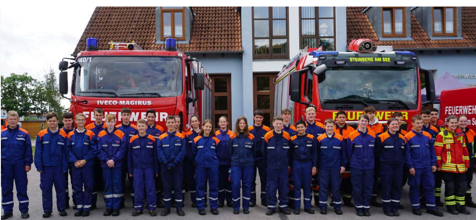
Sie haben die Tests zur Jugendflamme 2 erfolgreich absolviert – herzlichen Glückwunsch!